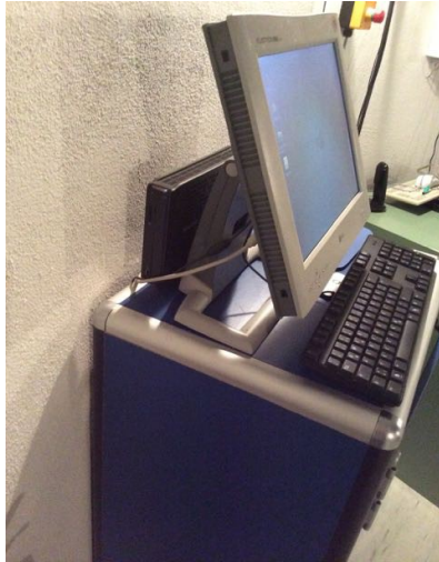
Bild1: Lage des Rechners